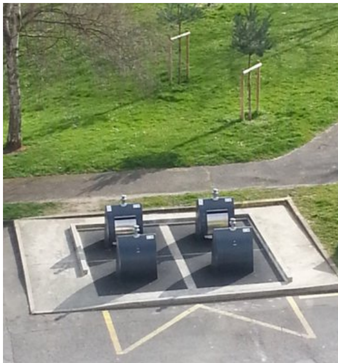
L'exemple très concret des poubelles enterrées à la permanence

Et d'ajouter "Quoi qu'il en soit, le SMITOM-LOMBRIC constate la diminution du poids des collectes de déchets ménagers depuis 5 ans. Parallèlement, le traitement de Déchets industriels banaux (DIB) augmente, l'objectif étant de maintenir la saturation des fours, car ce sont dans ces conditions de fonctionnement que les performances environnementales de l'UVE sont les optimales, ainsi que le coût de traitement rapporté à la tonne. Pour la récupération de ce type de déchets, le SMITOM-LOMBRIC signe des conventions avec divers partenaires du territoire (Big Bennes, Tournan, ...) ».