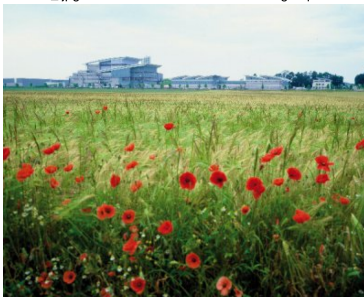
L'usine de valorisation énergétique